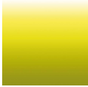
ZADIG Anis 62