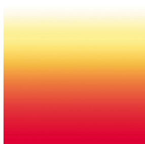
ZADIG Agrume 69 Druck design