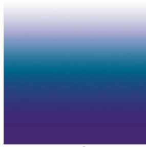
ZADIG Bleu 41