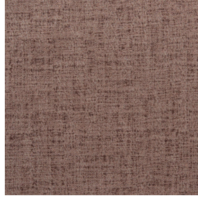
MURA DUNE 170 Druck design