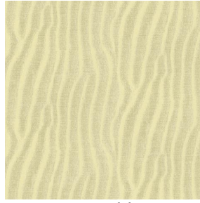
SABLE Sable 67