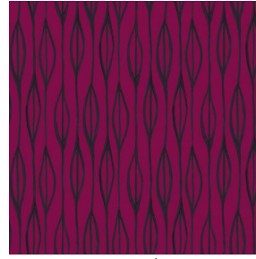
YENDI Opéra 104