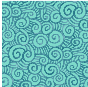
TUMULTE Menthe 122 Druck design