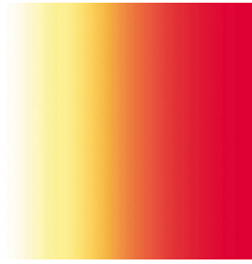
ZENITH Agrume 69