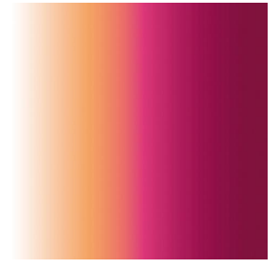
ZENITH Pivoine 57