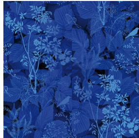
ODE Bleu 41 Druck design