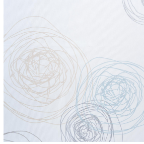
NAHIA OR 94 Druck design