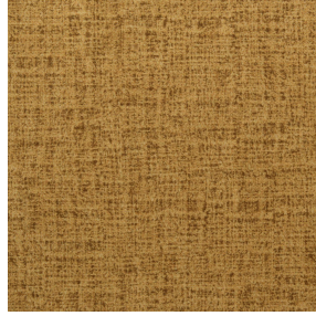
MURA SAVANE 185 Druck design