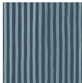
SONG Titanium 98