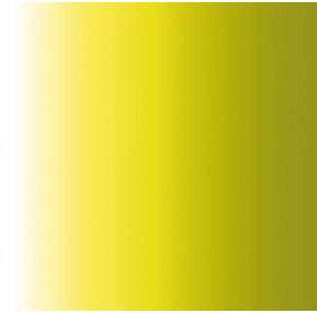
ZENITH Anis 62 Druck design