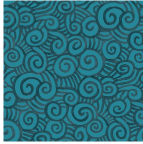
TUMULTE Orage 123