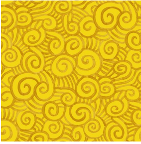
TUMULTE Mais 37