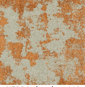
SIERRA chaudron 118