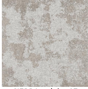
SIERRA ardoise 87