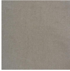
SIENTO WOODY Osier 171