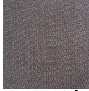
SIENTO LINA Girofle 186