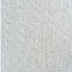
SIENTO LINA Dune 170