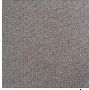
SIENTO LINA Muscade 175