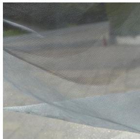
ORGANZA Argent 73