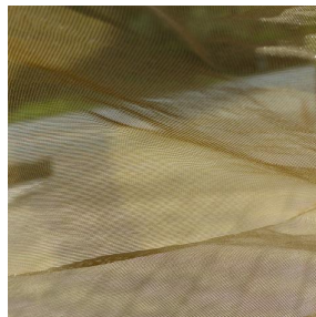
ORGANZA Or 94