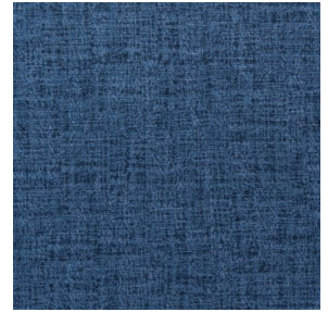
NOCTURNE MURA 2334 Saphir 106