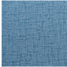
NOCTURNE MURA 2334 Glacier 43