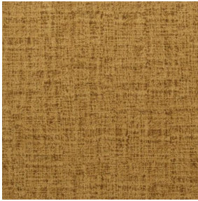
NOCTURNE MURA 2334 Savane 185