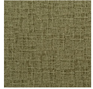
NOCTURNE MURA 2334 Olive 61