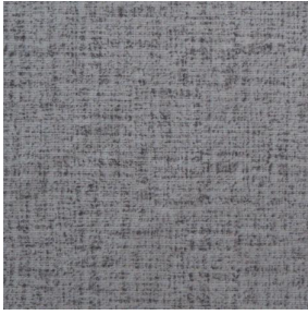
NOCTURNE MURA 2334 Minéral 157