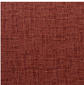
NOCTURNE MURA 2334 Grenat 56