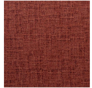
NOCTURNE MURA 2334 Grenat 56