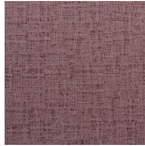
NOCTURNE MURA 2334 Rose 129