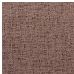
NOCTURNE MURA 2334 Dune 170