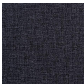
NOCTURNE MURA 2334 Fusain 71