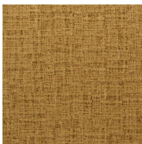
NOCTURNE MURA 2334 Savane 185