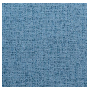
NOCTURNE MURA 2334 Glacier 43