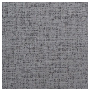
NOCTURNE MURA 2334 Minéral 157