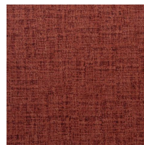
NOCTURNE MURA 2334 Grenat 56