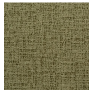
NOCTURNE MURA 2334 Olive 61