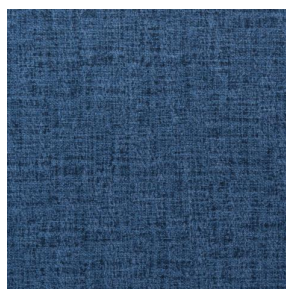
NOCTURNE MURA 2334 Saphir 106