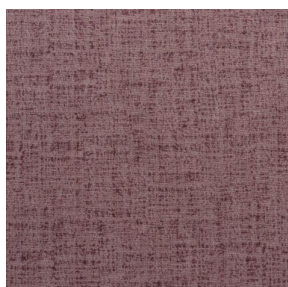
NOCTURNE MURA 2334 Rose 129