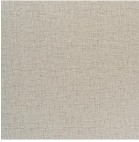
NOCLIN MURA 2334 Ivoire 115