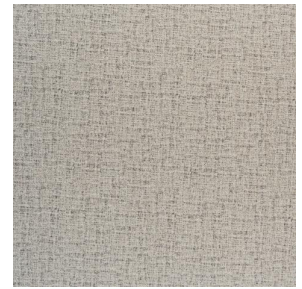
NOCLIN MURA 2334 Mastic 48