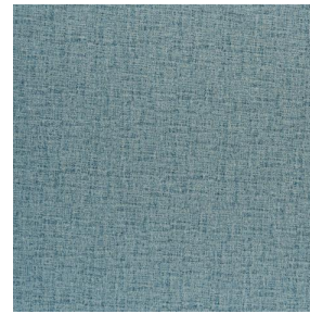
NOCLIN MURA 2334 Glacier 43