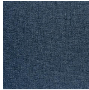
NOCLIN MURA 2334 Saphir 106