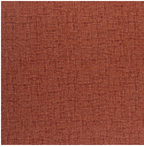
NOCLIN MURA 2334 Grenat 56