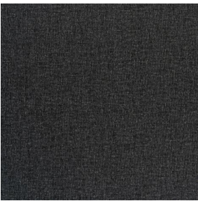
NOCLIN MURA 2334 Fusain 71