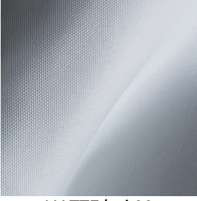
NATTE bpi 00