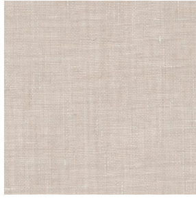
ETEL Lin 11