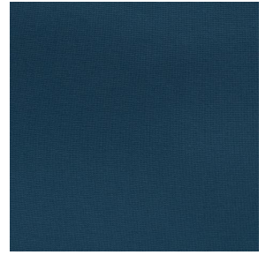
COLLEGE Indigo 144