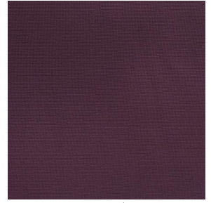
COLLEGE Evêque 154