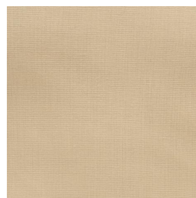
COLLEGE Paille 83