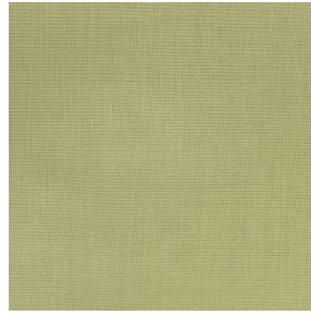
COLLEGE Olive 61