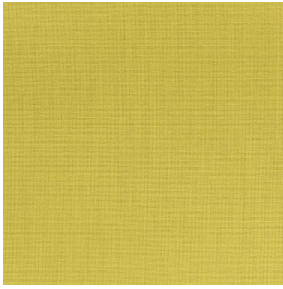
COLLEGE Bergamotte 121