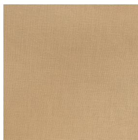
COLLEGE Mordoré 133