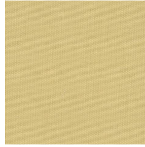
COLLEGE Poussin 20