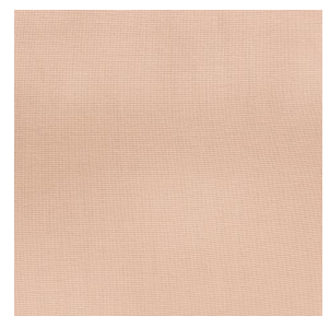
COLLEGE Pêche 52