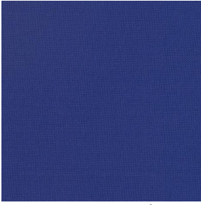
COLLEGE Naval 17