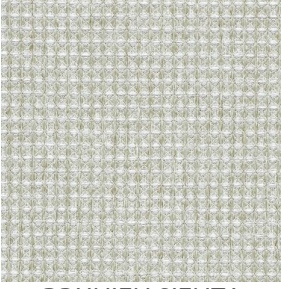
BRUNIEN SIENTA Naturel 26