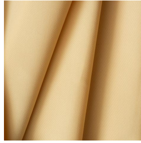
BIOTAM Mais 37