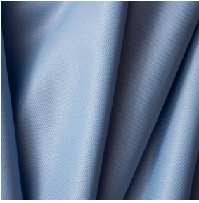
BIOTAM Lavande 89