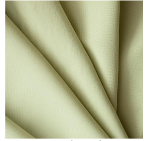
BIOTAM Absinthe 132