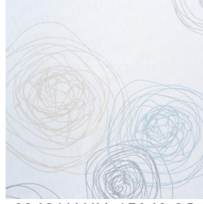
834S NAHIA 15068 OR 94